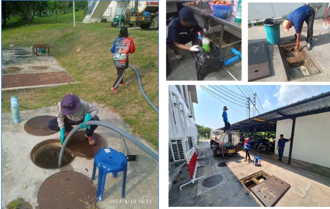
รูปที่ 1.6 (3) การสูบน้ำออกจากระบบบำบัดไปกำจัด