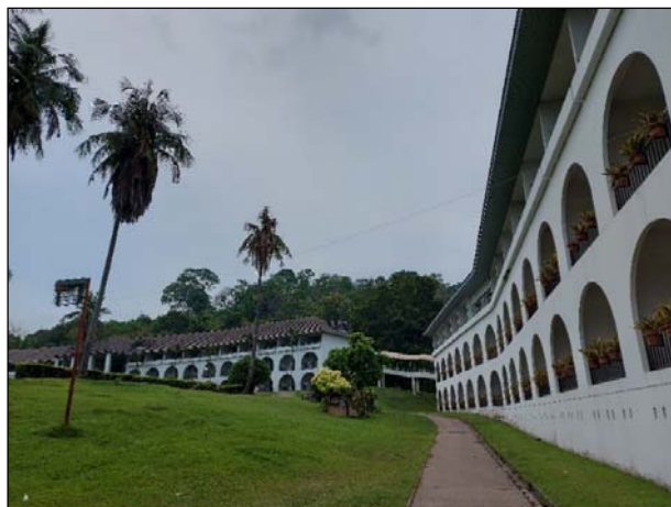
รูปที่ 3.4(2) ทักษะภาพและสุนทรียภาพ การจัด และตกแต่งพื้นที่สีเขียว