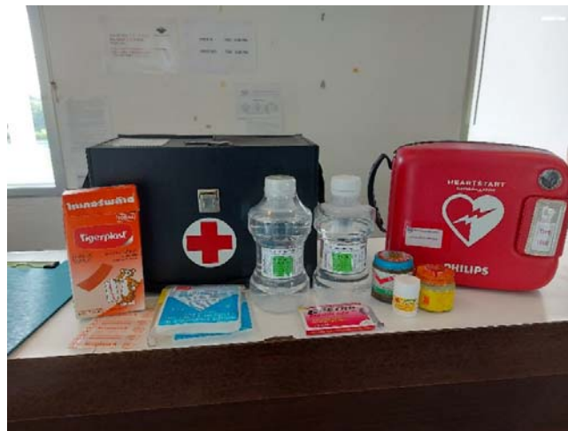
รูปที่ 3.3(1) มีเครื่องมือ/อุปกรณ์ใช้ในการ ปฐมพยาบาลเบื้องต้น