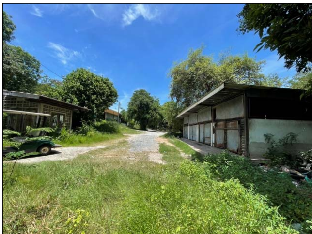
รูปที่ 2.3(3) มีการทำความสะอาดพื้นห้องพัก ขยะเปียก ภายหลังเก็บขนขยะมูลฝอย

รวมขยะภายในมีถังขยะปิดมิดชิด ขนาด 240 ลิตร ตั้งไว้ภายในเพื่อป้องกันการรั่วไหล