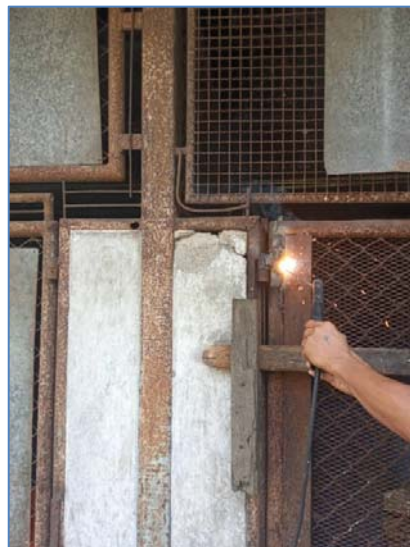
รูปที่ 2.3(2) จัดให้มีโรงพักขยะแยกประเภท

รวมขยะภายในมีถังขยะปิดมิดชิด ขนาด 240 ลิตร ตั้งไว้ภายในเพื่อป้องกันการรั่วไหล