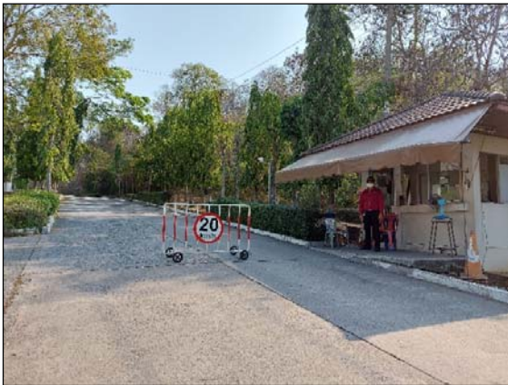
รูปที่ 3.1(1) เจ้าหน้าที่รักษาความปลอดภัย ดูแลทางเข้า-ออก ด้านหน้าโครงการ