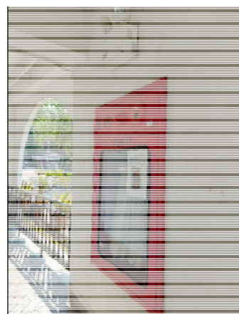
รูปที่ 3.2(4) ตู้สายฉีดน้ำดับเพลิง (Fire Hose Cabinet) ติดตั้งไว้ภายในอาคาร