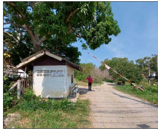
รูปที่ 3.1(2) เจ้าหน้าที่รักษาความปลอดภัย ดูแลทางเข้า-ออก หลังโครงการ (บริเวณบ้านพักคนงาน)