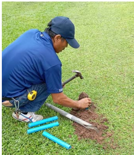
รูปที่ 2.1 ตรวจสอบรอยแตก/ชำรุดของระบบจ่ายน้ำ และระบบเส้นท่อประปาให้อยู่ในสภาพดีอยู่เสมอ