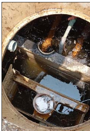
รูปที่ 3.3(3) มีการฆ่าเชื้อโรคด้วยคลอรีน ก่อนปล่อยสู่แหล่งรองรับน้ำทิ้ง