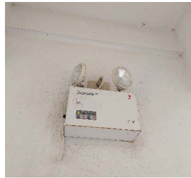
รูปที่ 3.2(6) ตรวจสอบชุดไฟฉุกเฉิน