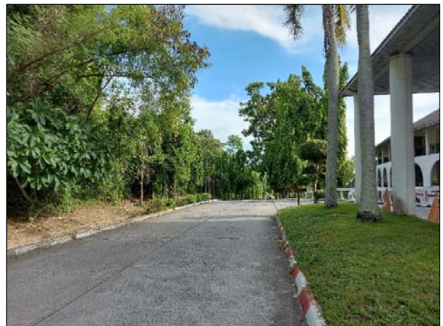
รูปที่ 1.2 (1) ถนนในโครงการอยู่ในสภาพดีและสะอาด