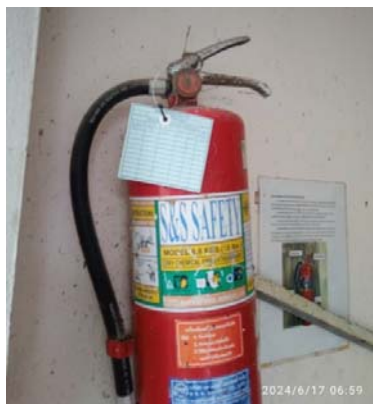
รูปที่ 3.2(3) จัดให้มีถังดับเพลิงชนิดมือถือ ชนิด Dry Chemical ขนาด 10 ปอนด์