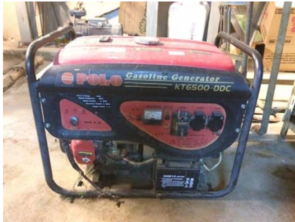
รูปที่ 3.2(5) เครื่องปั่นไฟขนาด 5KW