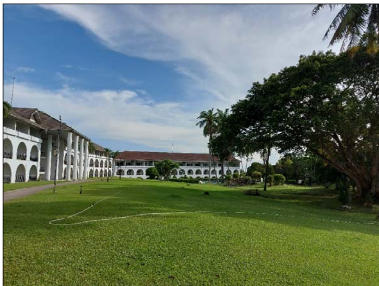
รูปที่ 3.4(1) ทักษะภาพและสุนทรียภาพ ถนนใน โครงการอยู่ในสภาพดี และสะอาดอยู่เสมอ