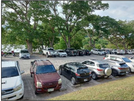
รูปที่ 2.5(1) ลานจอดรถ บริเวณหน้าอาคาร คลับเฮ้าส์