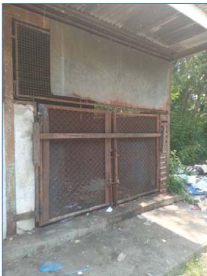
รูปที่ 2.3(1) จัดให้มีโรงพักขยะแยกประเภท