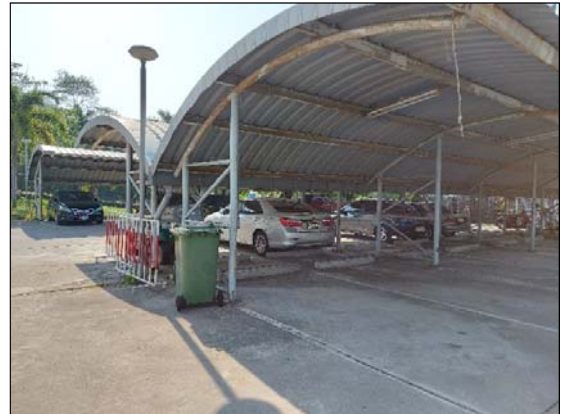
รูปที่ 2.5(2) ลานจอดรถ บริเวณ หน้าอาคารโรงแรมสวนขยาย