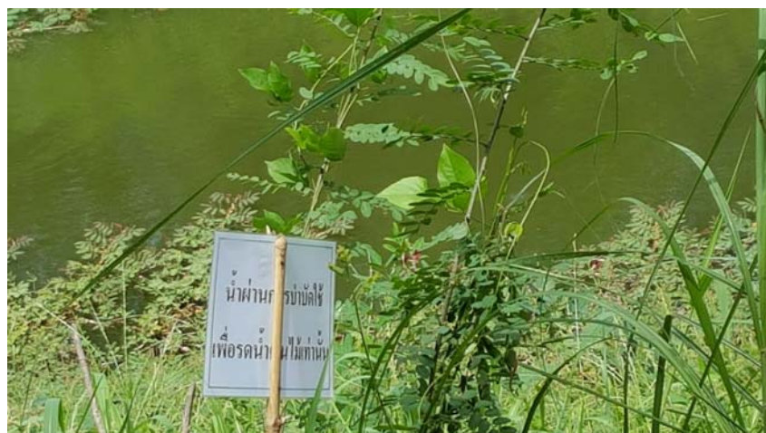
รูปที่ 1.6 (2) บ่อรับน้ำที่ 20 เพื่อนำมาใช้รดน้ำต้นไม้และสนามหญ้า และป้าย ห้ามจับสัตว์น้ำ