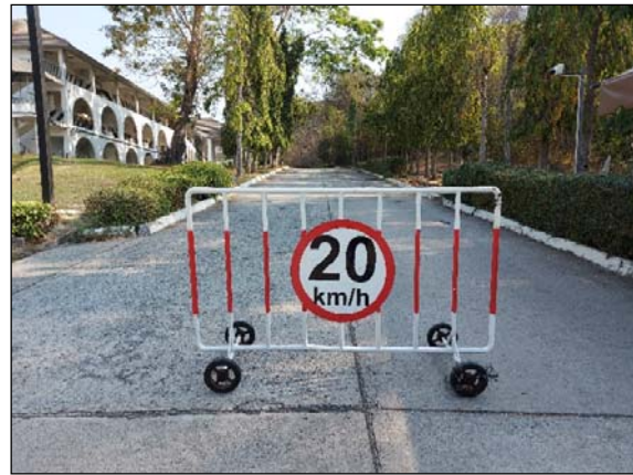
รูปที่ 1.4(1) มีการติดป้ายจำกัดความเร็ว