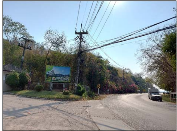
รูปที่ 1.1(1) จัดทำรั้วโดยรอบพื้นที่โครงการ