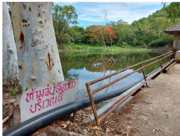
รูปที่ 1.6 (1) บ่อรับน้ำที่ 3 เพื่อนำมาใช้รดน้ำต้นไม้และสนามหญ้า