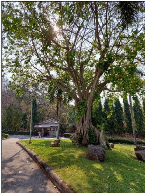
รูปที่ 1.1(2) จัดให้มีพื้นที่สีเขียว มีการปลูก ต้นไม้และหญ้าคลุมดินในบริเวณพื้นที่ว่าง